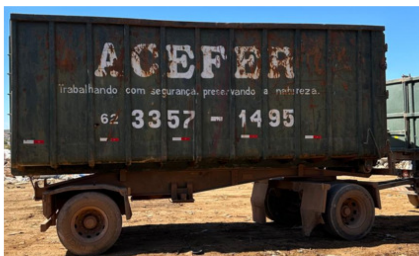
FOTO – 02 VISTA LATERAL DO REBOQUE GRIMALDI