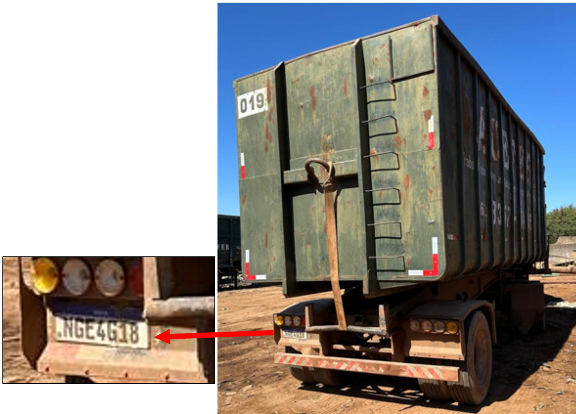
FOTO – 01 VISTA TRASEIRA DO REBOQUE GRIMALD