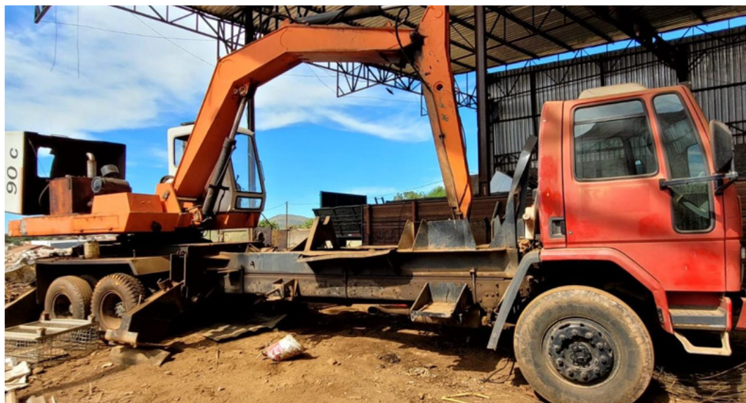
FOTO – 02 VISTA LATERAL DO CAMINHÃO FORD CARGO 3224