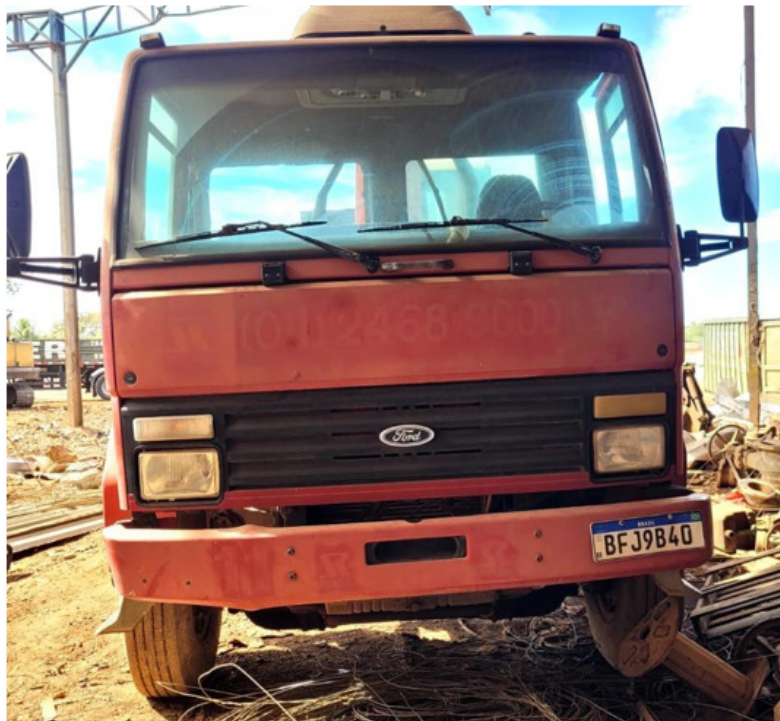
FOTO – 01 VISTA FRONTAL DO CAMINHÃO FORD CARGO 3224