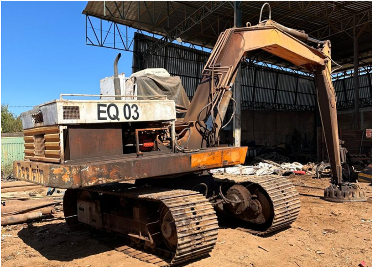
FOTO – 01 VISTA LATERAL DA ESCAVADEIRA POCLAIN