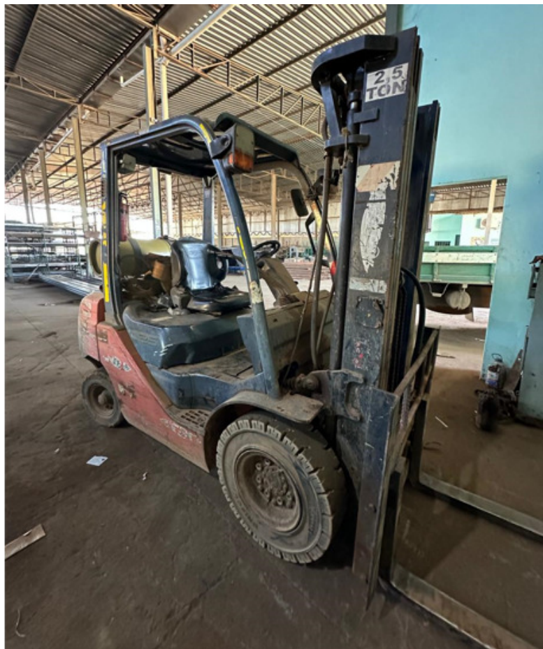
FOTO – 01 VISTA LATERAL DA EMPILHADEIRA TOYOTA