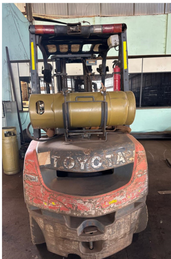
FOTO – 02 VISTA TRASEIRA DA EMPILHADEIRA TOYOTA