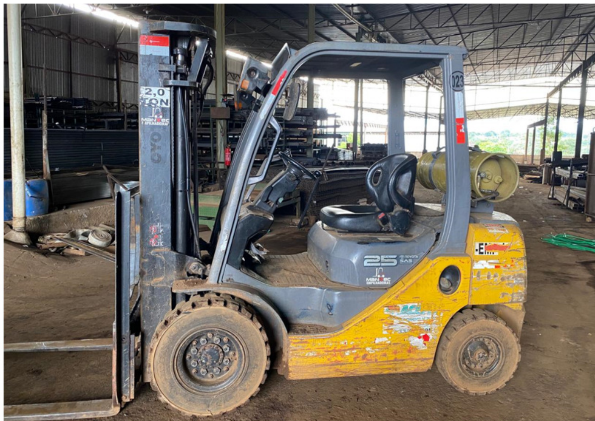
FOTO – 01 VISTA LATERAL DA EMPILHADEIRA TOYOTA